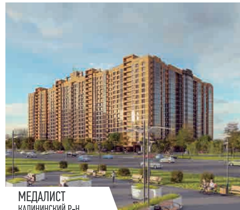
МЕДАЛИСТ КАЛИНИНСКИЙ Р-Н