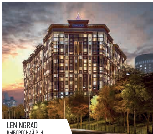
LENINGRAD ВЫБОРГСКИЙ Р-Н