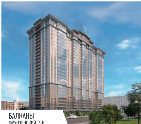
БАЛКАНЫ ФРУНЗЕНСКИЙ Р-Н