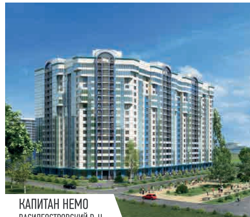
КАПИТАН НЕМО ВАСИЛЕОСТРОВСКИЙ Р-Н