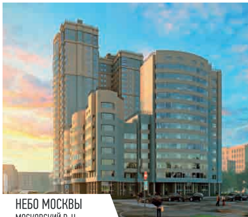
НЕБО МОСКВЫ МОСКОВСКИЙ Р-Н