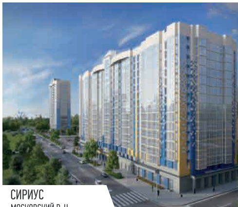
СИРИУС МОСКОВСКИЙ Р-Н